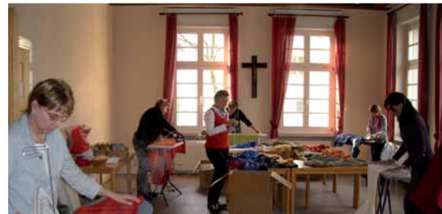
Die Vorbereitungen haben begonnen: Für ca. 80 Könige werden die Kleider gerichtet

Wenn die Könige den Segen in Ihr Haus bringen sollen, tragen Sie sich bitte in die Listen ein, die an den Kirchentüren ausliegen. Natürlich brauchen wir auch viele Könige, Sternenträger und auch Eltern, die die Gruppen begleiten. Wer sich daran beteiligen möchte, oder noch weitere Informationen braucht, kann sich bei Ute Neubauer (Telefon: 71 28 82 oder Mail: dneubauer@t-online.de ) melden.