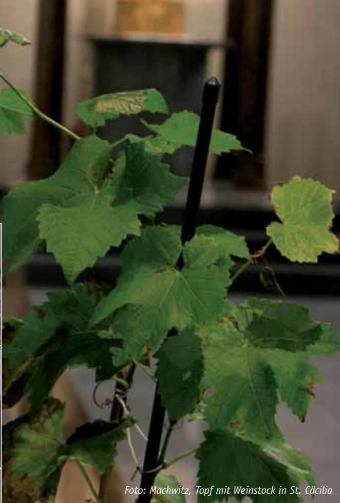
Topf mit Weinstock in St. Cäcilia