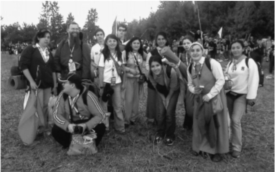
"Unsere Chilenen" voller Begeisterung auf dem Weltjugendtag in Köln